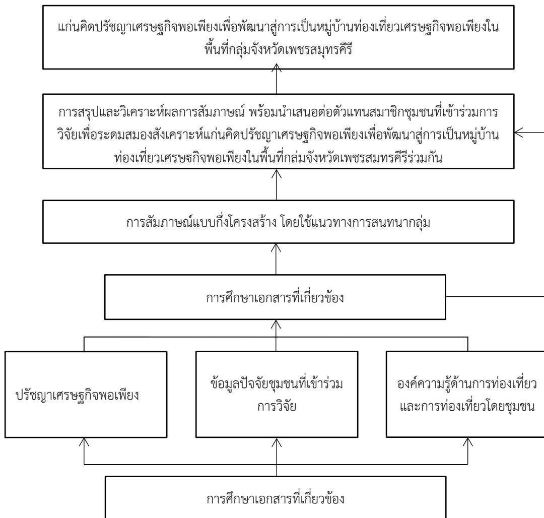
แผนภาพที่ 1 กรอบแนวคิดในการวิจัย

การศึกษาวิจัยเรื่อง “การวิจัยเชิงปฏิบัติการแบบมีส่วนร่วมเพื่อค้นหาและสังเคราะห์แก่นคิดปรัชญาเศรษฐกิจพอเพียงเพื่อพัฒนาสู่การเป็นหมู่บ้านท่องเที่ยวเศรษฐกิจพอเพียงในพื้นที่กลุ่มจังหวัดเพชรบูรณ์” ในครั้งนี้ ผู้ศึกษาวิจัยได้กำหนดกรอบแนวคิดในเชิงกระบวนการในการวิจัย ดังนี้