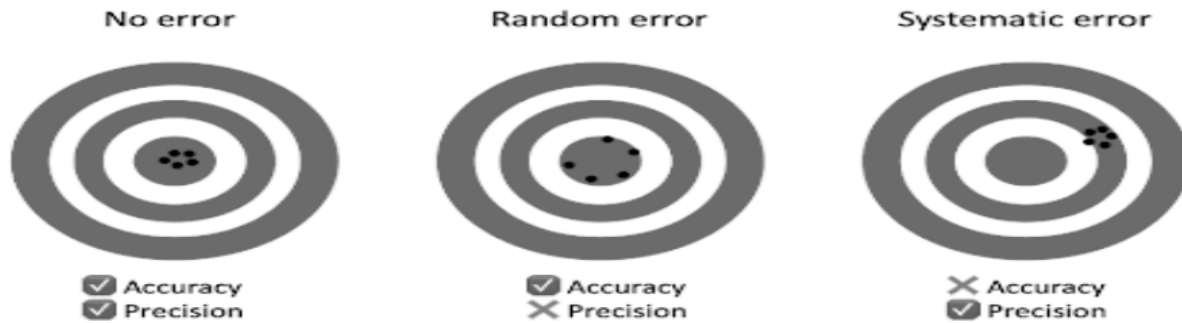
شكل (1) يبين اشكال وانواع الخطا في القراءات المختبرية

وبناءً على ما سبق، يتضح أن معيار ISO/IEC 17025 يمنح الكفاءة البشرية أولوية محورية، إذ يشترط أن يمتلك العاملون المؤهلات العلمية والخبرات العملية الملائمة لكل اختبار، وأن يتم تقييمهم دورياً لضمان استمرار قدراتهم. ويشكل هذا الجانب الأساس في بناء منظومة فنية قادرة على تحقيق الاتساق والثبات في القياسات.