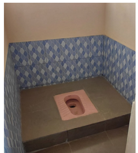
Einfache Toiletten mit Tür