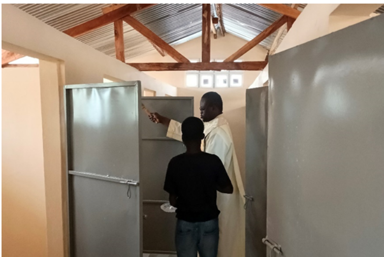
links 4 Toiletten, rechts 4 Duschkabinen in beiden Gebäuden