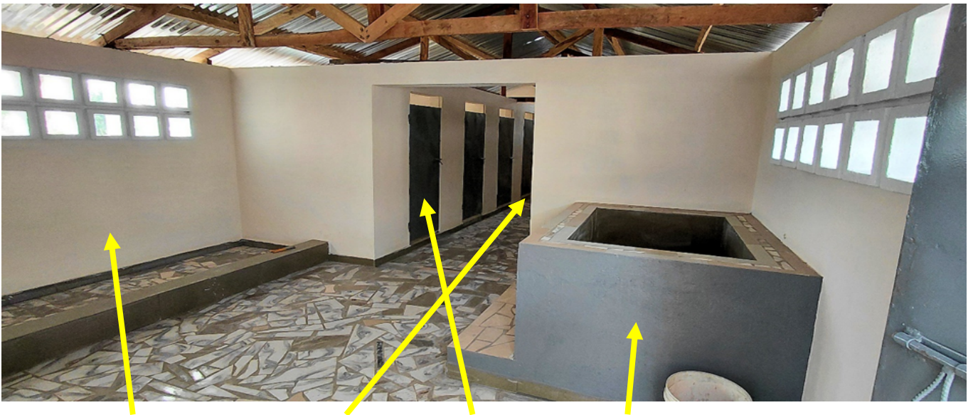
Duschen mit Wassereimer – Duschkabinen – Toiletten - Wasserbecken