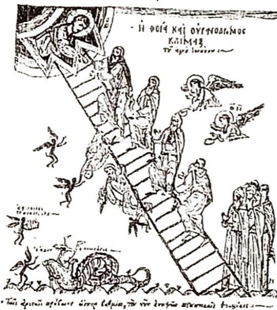
«Τὴν ἀρετὴν ἀπέλασε ἄνευ ἐλπίου, πρὶν ἀνοήτως ἀποσπασθῆναι τῆς γῆς»

Παράλληλα, πρέπει να νηστεύει και η ψυχή. Πως; Όταν προσεύχεται κάθε μέρα, εξομολογείται και κοινωνάει συχνά και όταν καθημερινά νηστεύει από τα πάθη της. Για παράδειγμα: Αγωνίζεται να λέει λιγότερα ψέμματα, βρισιές,