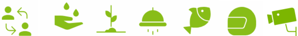
Seven areas of interventions that sustain United Nations Peace, security and development

L'IPHD-International Promoting Human Development « IFME-Internationale Foerderung Menschlicher Entwicklung » est une organisation internationale non gouvernementale qui utilise sept domaines d'intervention pour promouvoir le développement humain en apportant des solutions aux alertes rouges des Nations Unies en soutenant les 17 objectifs de développement durable des Nations Unies Dans le monde. Nous agissons comme un laboratoire virtuel et physique d'idées, en incubant des initiatives qui contribuent aux objectifs de développement durable des Nations Unies et à l'Agenda 2030. L'objectif global est de soutenir/développer ou créer des projets issus du développement de l'humain. La PIDH « IFME » est une organisation internationale non gouvernementale pour les professionnels et apprentis dans divers domaines. L'être humain est au centre de son activité. Ses activités sont réparties en sept domaines d'interventions . La mission de « FME » est de contribuer pour le développement/ la croissance de l'homme à travers la sensibilisation de nos sept domaines d'interventions. L'objectif général est de soutenir/ développer ou créer des projets allant dans le sens de développement de l'homme. La PIDH à les professionnels et apprentis dans les différents domaines mentionnés.