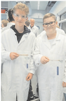
NMS-Schüler im Labor der TU.