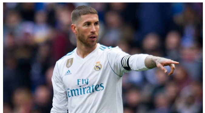
Sergio Ramos comme modèle.