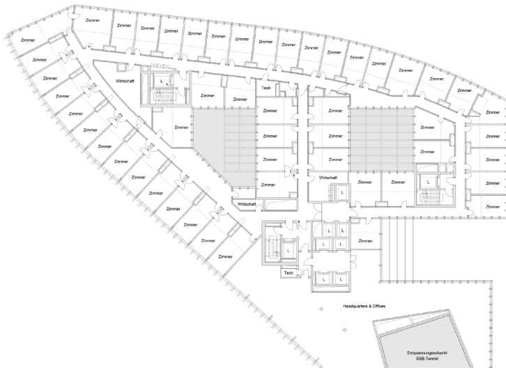
Grundriss Teilprojekt H11, Hotel Hyatt Place (BIM CAD-Software Allplan)