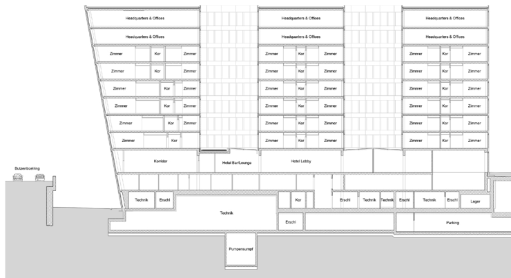
Schnitt Teilprojekt H11, Hotel Hyatt Place (BIM CAD-Software Allplan)

umschliesst. Hinter dieser Fassade sind gegen den Hügel hin verschiedene kubische Bauten aus viel Glas angeordnet. Vom Flughafen her vermittelt das Projekt das Bild eines einheitlichen und „grossmassstäblichen Gebäudes“ und von der Hügelseite her das einer kleinen Stadt, heisst es im Jurybericht. Aus der vom Architekten gewählten Strategie lasse sich eine gewisse „Swissness“ ablesen. Die Idee einer Innenstadt mit Strassen, Gassen und Plätzen entspreche der Philosophie von „The Circle“. Mit Leben füllen sollen das neue Dienstleistungszentrum unter anderem zwei Hotels, ein Convention Center, ein medizinisches Zentrum des Universitätsspitals Zürich sowie Geschäfte, Restaurants und Angebot aus den Bereichen Kunst, Kultur, Unterhaltung und Bildung.