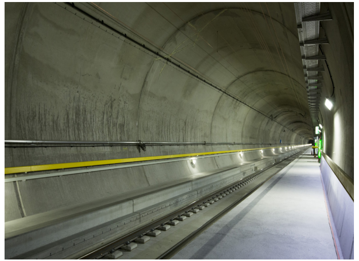
System mit zwei Einspurröhren von je 57 km Länge