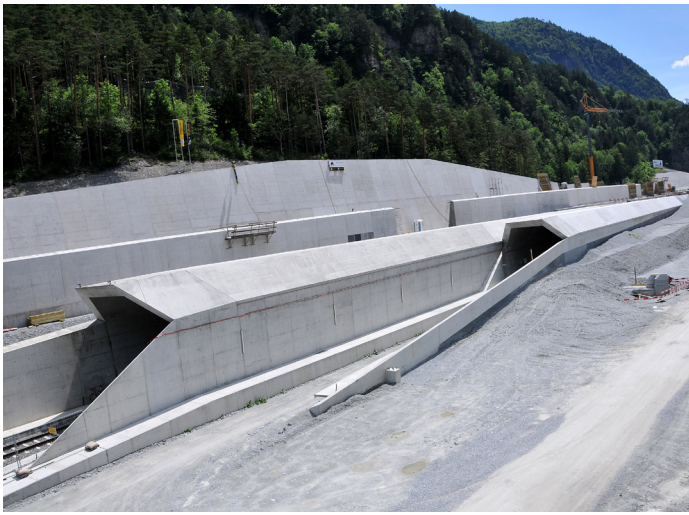
Portale Gotthard-Basistunnel Nordseite bei Erstfeld

beiden Tunnelröhren treffen. Die sich ergebenden räumlichen Verschneidungen der verschiedenen Strukturen konnten in der 3D-Visualisierung ideal dargestellt und bearbeitet werden. Aber auch in der Erarbeitung der Bewehrungspläne gab uns das 3D-System die Sicherheit, dass die gezeichnete Bewehrung auch wirklich passt.“