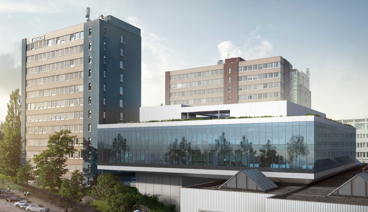
Visualisierung Bühler Cubic (Innovation Center) Uzwil