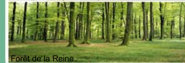
Forêt de la Reine