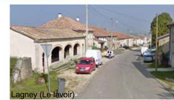
Lagnéy (Le lavoir)