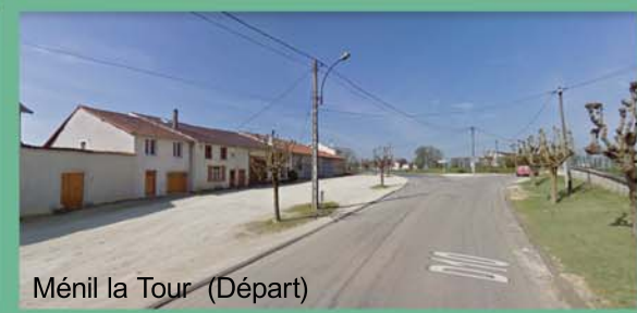
Méné la Tour (Départ)