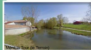
Méné la Tour (le Terroin)