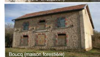
Boucq (maison forestière)