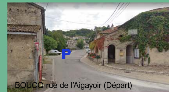
BOUCQ rue de l'Aigayoir (Départ)

8- A l'aire de pique-nique, poursuivre à gauche sur le chemin empierré et passer la barrière. Au bout de ce chemin, franchir une seconde barrière et emprunter à gauche la route goudronnée. Environ 2 km plus loin, suivre la route de Commercy. Dans le village, emprunter la Rue Basse et rejoindre le point de départ.