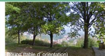
Boucq (table d'orientation)