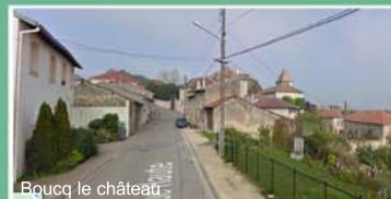
Boucq le château