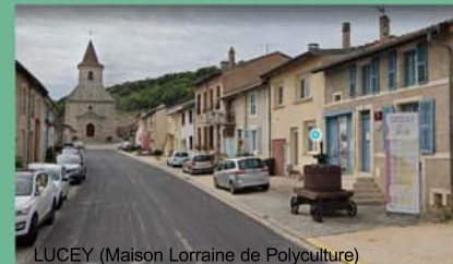
LUCEY (Maison Lorraine de Polyculture)