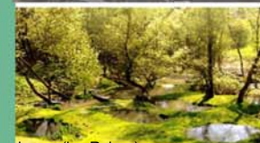
Lucey (les Roises)