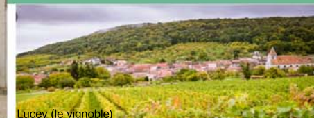
Lucey (le vignoble)