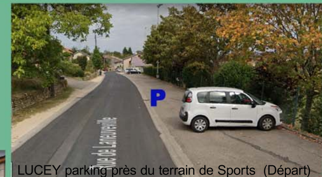
LUCEY parking près du terrain de Sports (Départ)