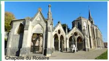
Chapelle du Rosaire