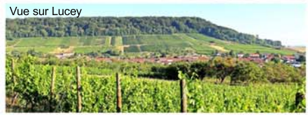
Vue sur Lucey