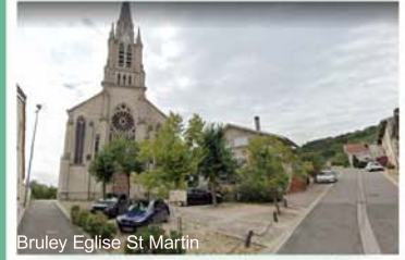
Bruley Eglise St Martin