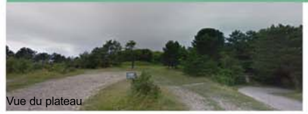
Vue du plateau