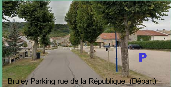
Bruley Parking rue de la République (Départ)