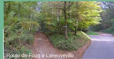
Route de Foug à Laneuveville