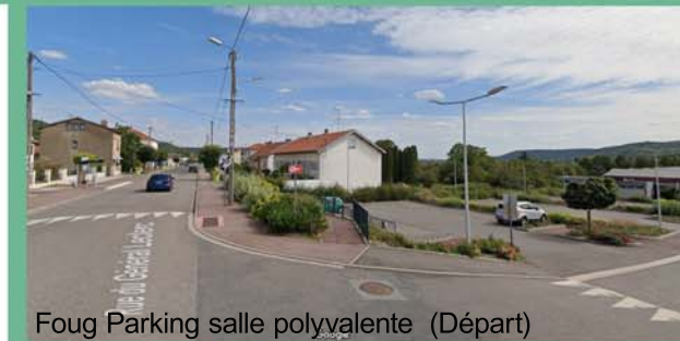
Foug Parking salle polyvalente (Départ)