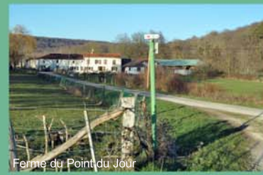
Ferme du Point du Jour