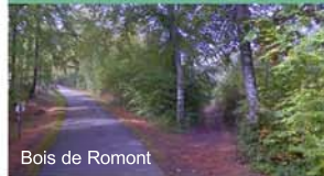
Bois de Romont