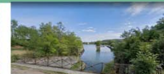
Foug (tunnel du canal de la Marne au Rhin)