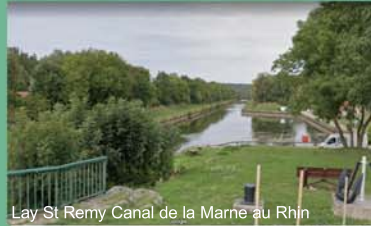
Lay St Remy Canal de la Marne au Rhin