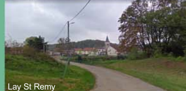
Lay St Remy