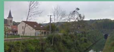
Lay St Remy (tunnel du canal de la Marne au Rhin)