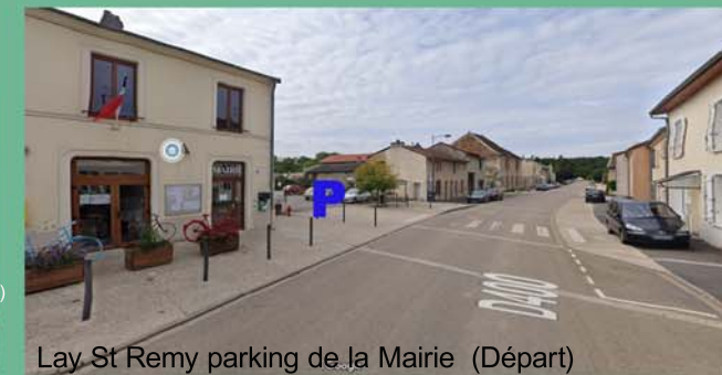
Lay St Remy parking de la Mairie (Départ)