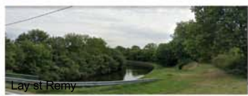
Lay st Remy