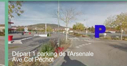
Départ 1 parking de l'Arsenal Ave Col Péchot