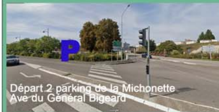
Départ 2 parking de la Michonette Ave du Général Bigeard