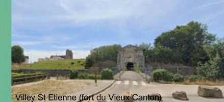
Villey St Etienne (fort du Vieux Canton)