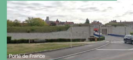
Porte de France