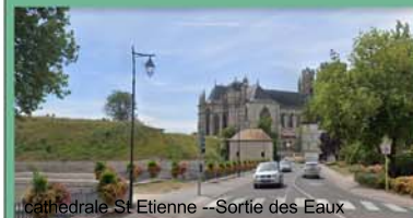
Cathédrale St Etienne --Sortie des Eaux