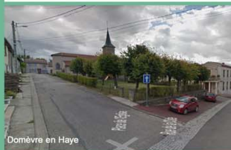
Domèvre en Haye

6- Arrivé au chemin blanc tourner à gauche puis prendre le chemin à droite en direction du bois de la Rappe. Suivre le chemin à gauche jusqu'à la voie romaine, prendre à gauche pour revenir au parking sans passer par le lavoir.