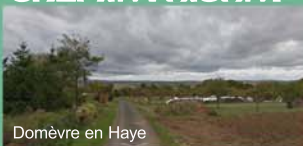
Domèvre en Haye