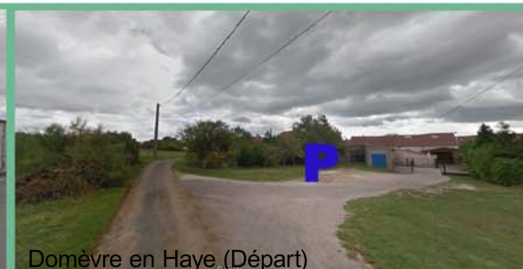
Domèvre en Haye (Départ)