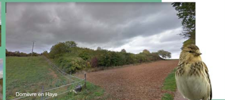
Domèvre en Haye

LA LINOTTE Association intercommunale des sentiers de randonnée