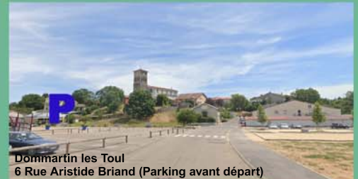
Dommartin les Toul 6 Rue Aristide Briand (Parking avant départ)