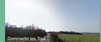
Dommartin les Toul