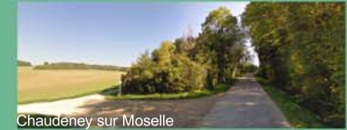
Chaudeney sur Moselle