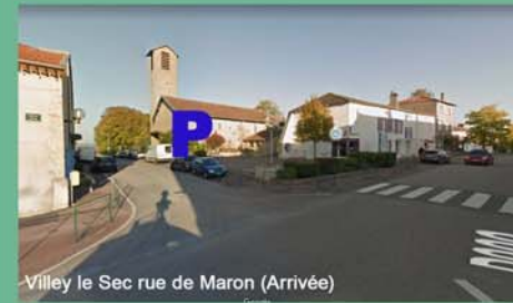
Villey le Sec rue de Maron (Arrivée)