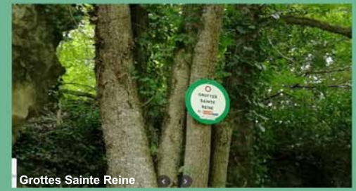
Grottes Sainte Reine