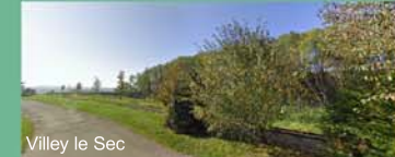
Villey le Sec