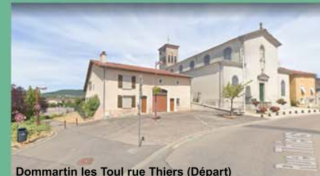
Dommartin les Toul rue Thiers (Départ)