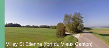
Villey St Etienne (fort du Vieux Canton)