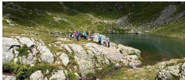
Le Lac Noir