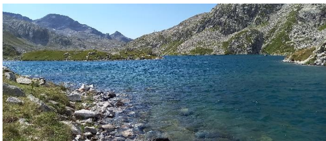
Le Lac des 7 Laux