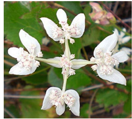
Abb.2: Southern Cross – living essences – australische Blütenessenz

mit Magnesium und der australischen Blütenessenz Southern Cross.