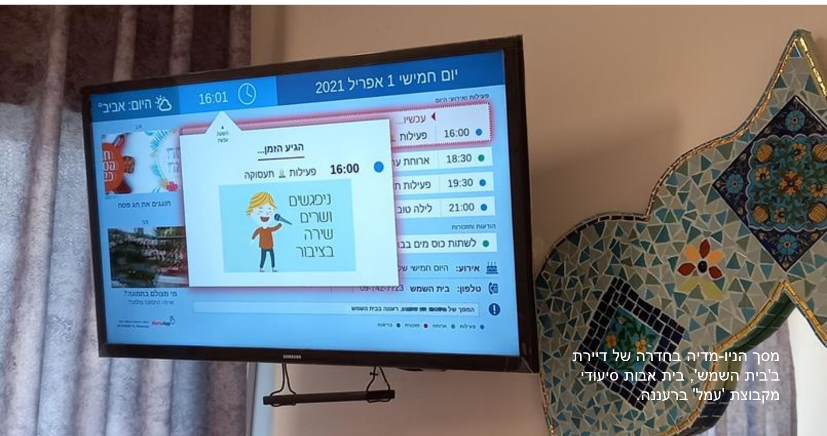
מסך הניו-מדיה בחדרה של דיירת 'בית השמש', בית אבות סיעודי מקבוצת 'עמל' ברעננה.

בעזרת מערכות הניו-מדיה של 'ממואפ' מכניסים חיים וחוויה טיפולית חדשה - תורמים לשדרוג ולשינוי חיובי לדיירים, לצוות ולבני המשפחה.