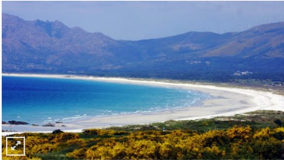
SIMON BALVIS. Playa de Carnota.