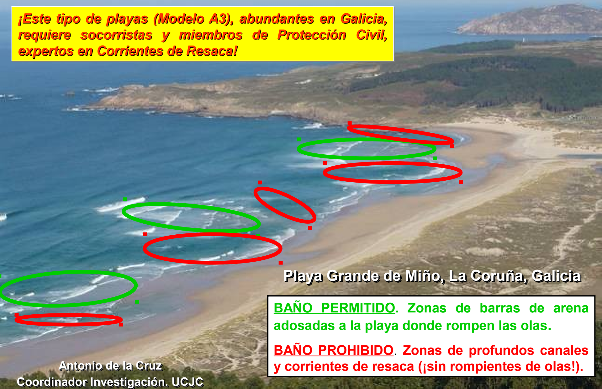
Playa Grande de Miño, La Coruña, Galicia

¡Este tipo de playas (Modelo A3), abundantes en Galicia, requiere socorristas y miembros de Protección Civil, expertos en Corrientes de Resaca!