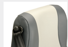
Cinturón 3 pt enrollable, exterior / Retractable exterior 3pt safety belt