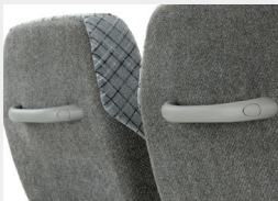
Asidero trasero / Handle backrest