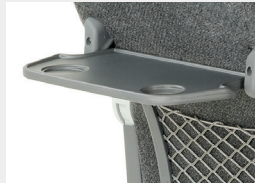
Mesita solidaria / Small table