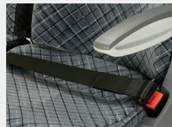
Cinturón 2 pt enrollable / Retractable 2pt safety belt