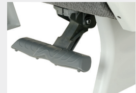
Apoyapiés 4 pos / Footrest 4 positions