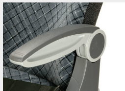
Apoyabrazos central - costado / Armrest central - side