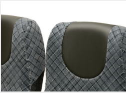
Espejo / Espejo