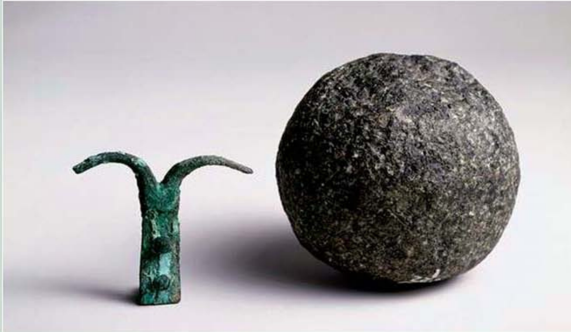
In alto, La Sfera di Pietra e il Doppio Uncino di rame scoperti da Dixon e conservati al British Museum. In basso, le immagini del frammento di legno di Cedro oramai in pezzi, ritrovato all'Università di Aberdeen.

esatta del monumento, ma suggerisce un periodo che gli antichi egizi conoscevano bene quando identificarono Cheope (Khufu) come il suo costruttore».