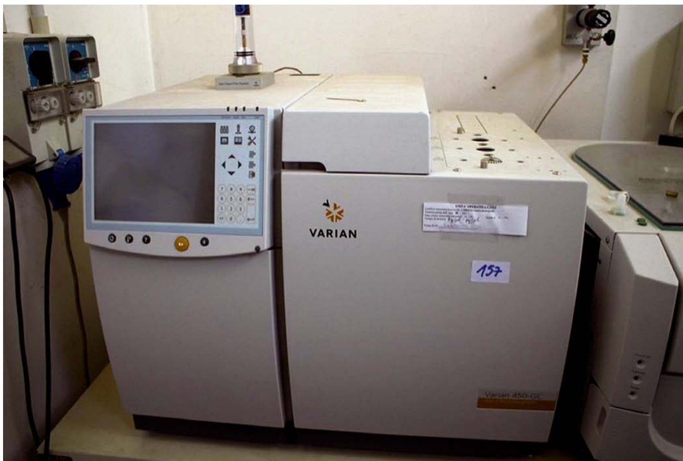
In alto, Gascromato grafo Varian.

campo medico o religioso. L'unica sostanza stupefacente ampiamente attestata nel Mediterraneo è l'oppio, numerose sono infatti le rappresentazioni del caratteristico calice del papavero. Semi di papavero sono stati ritrovati in contesti molto antichi, Neolitico e prima Età del Bronzo. Per quanto riguarda l'Egitto antico non è ben chiaro l'utilizzo di papavero da oppio; che la pianta fosse ben conosciuta è assodato, come dimostrano diversi reperti che rappresentano il caratteristico "calice" del papavero, come la collana di corniola e gli orecchini d'oro rinvenuti nella KV56. È difficile capire se nella fase più antica della storia egizia la resina di papavero fosse utilizzata in campo medico, ricreativo o religioso, poiché non esistono evidenze di questo tipo. Al contrario in Epoca Tarda, gli scritti classici ci confermano questo tipo di utilizzo. Il testo Materia Medica del I sec. ce., il più importante testo di farmaceutica fino al V sec. ce., conferma l'utilizzo dell'oppio in Egitto e a Roma sin dal I sec. bce. Si parla inoltre di un dibattito di oltre tre secoli sui vantaggi dell'utilizzo delle droghe a scopo terapeutico. Nel 1962 l'archeologo Robert Merrillees ipotizzò che l'oppio fosse importato in Egitto da Cipro, sulla base di una serie di vasi di produzione cipriota e rinvenuti in Egitto, la cui forma ricordava quella del calice di papavero.