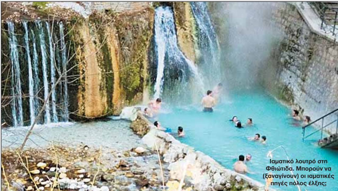
Ιαματικό λουτρό στη Φθιώτιδα. Μπορούν να (Ξαναγίνουν) οι ιαματικές πηγές πόλος έλξης;

βλημα μιας και για να βρεθεί λύση- «πακέτο» για τα γραφειοκρατικά ζητήματα που θα προχωρήσουν την επένδυση, ίσως να χρειαστεί και... μισός αιώνας.