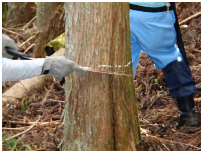
刃先は下がりやすいので注意！