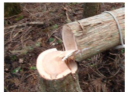
切り残し(ツル)の効いた伐倒。