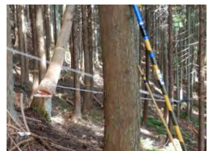
木回しは専用の道具を使いましょう！