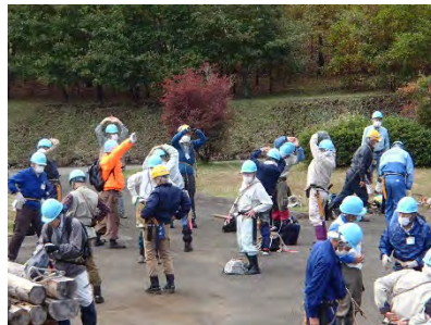
準備体操をしっかりと。