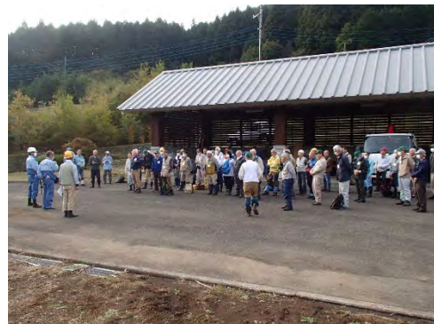
小川水源林管理所長あいさつ。