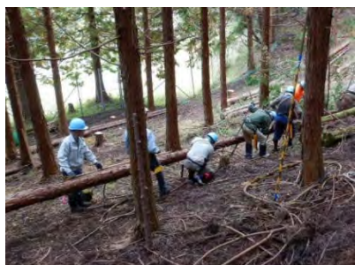
浮いた材の玉切り・枝払いは注意！