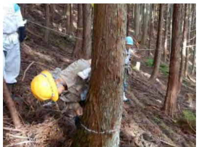
受け口の高さに合わせた追い口線。