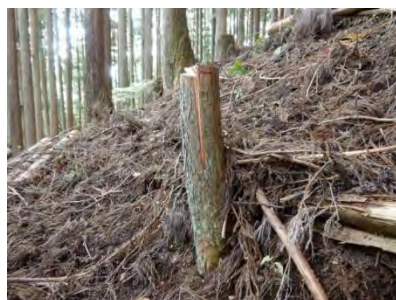
切り株が高いですね。