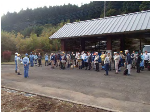
村居理事長あいさつ。

「今年度も皆様のご協力により、安全に森林整備を進めることができました。お礼申し上げます。ありがとうございました！」