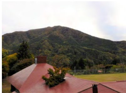
雲は多いながらも絶好の間伐日和。