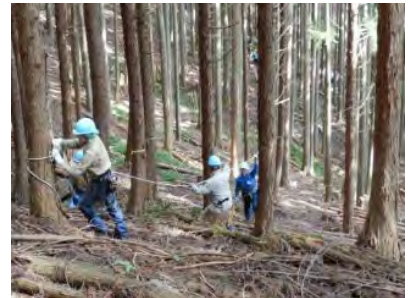
ロープは山側へ。鉄則ですね！