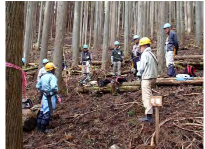
始まりの会で体調確認！