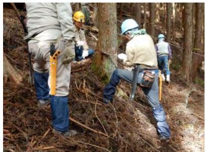
無理な体勢での作業は注意！