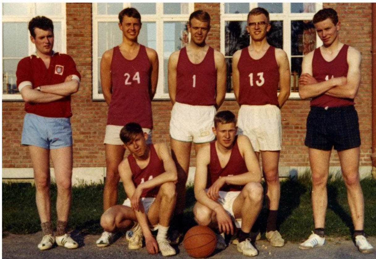
Askers første lag i 1972

Tusen takk til alle lag som har bidratt til at dette går an å gjennomføre!