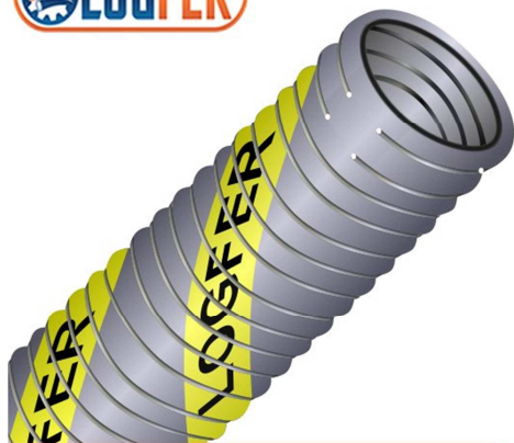
Mangueira composta - POLI PG

Modelo: POLI PG | Arame Int./Ext.: Aço revestido de PP/aço Galvanizado Cor: Cinza com faixa Amarela