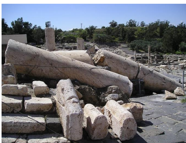
עדויות לרעש האדמה שפקד את בית שאן והחריב אותה