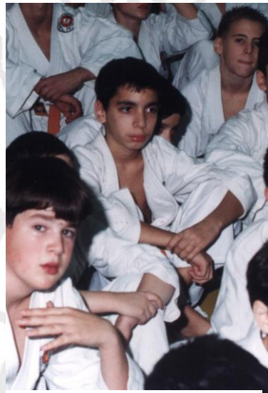
קורס חנוכה עם מאמן יפני.