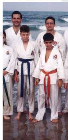
אימון בחוף הים.