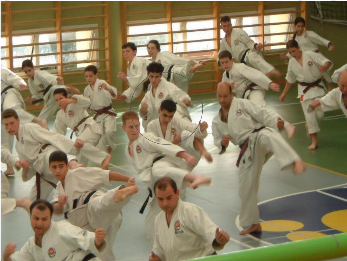
קורס מרוכז – אימון חגורות חומות שחורות, חיפה (אפריל 2002).