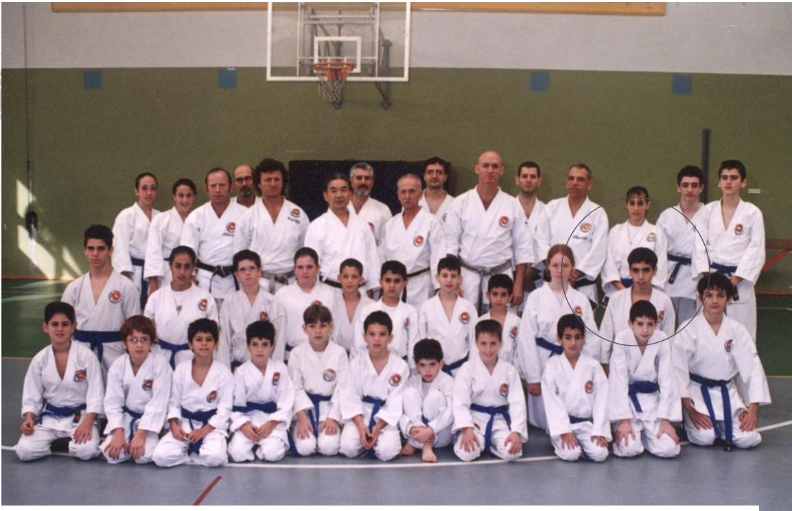
קורס עם מסטר מיקמי, נווה-שאנן, חיפה. תמונה קבוצתית – חגורות כחולות (דצמבר 2000).