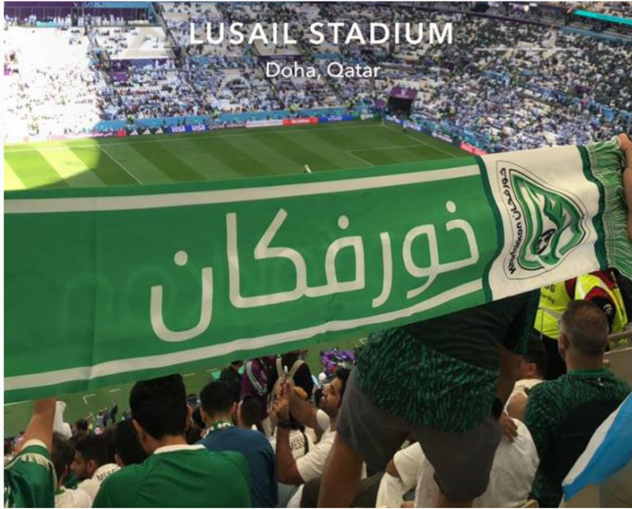
جمهور نادي خورفكان يؤازر المنتخب السعودي بين مشجعيه في استاد لوسيل بالدوحة