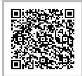
ASA VIRTUAL-O CORASA Percurso Linear Ataño do curso: YK7YHe