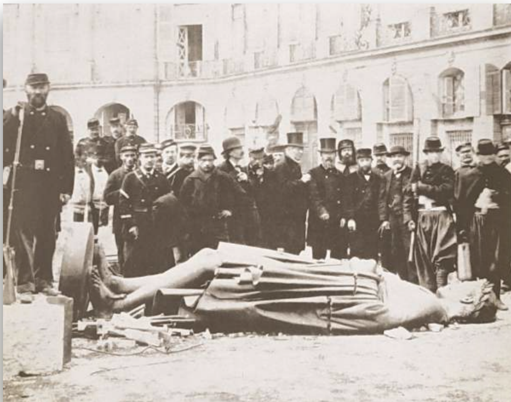
ستون وندوم که به فرمان ناپلئون اول (بناپارت) به یادبود پیروزی در نبرد استرلیتز بنا شده بود توسط کمونارها و به پیشنهاد گوستاو کوربه پایین کشیده شد.

■ مدیریت منافع هنرمندان را منحصر به خود هنرمندان بسپارید.