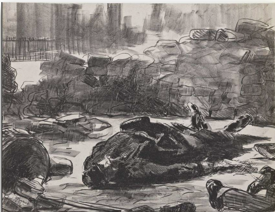
«جنگ داخلی»، اثر ادوار مانه

سمت راست کشیده شده است متعلق به یک غیرنظامی است که گواهی بر ماهیت این کشتار جمعی است.