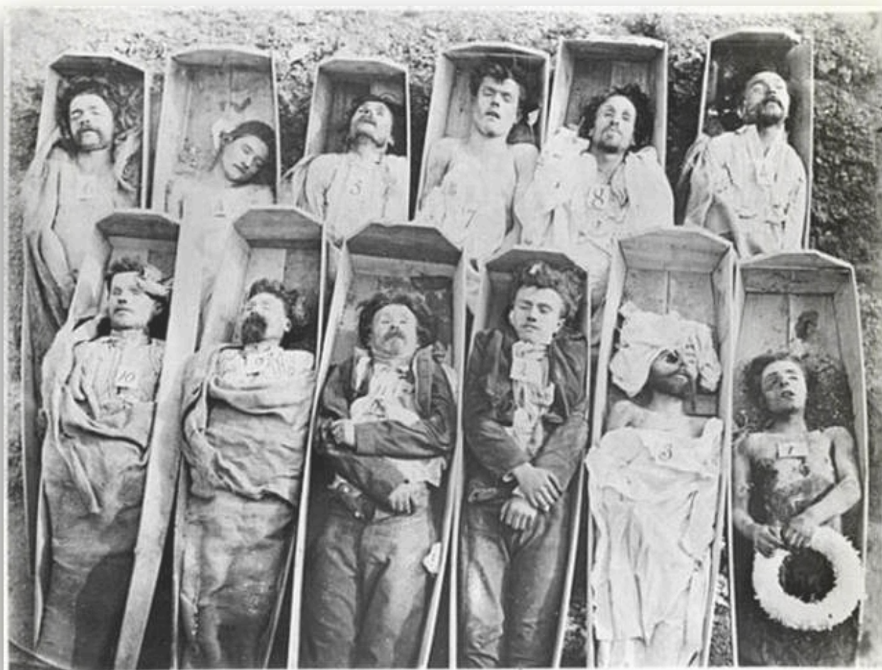
قتل عام کمونرها