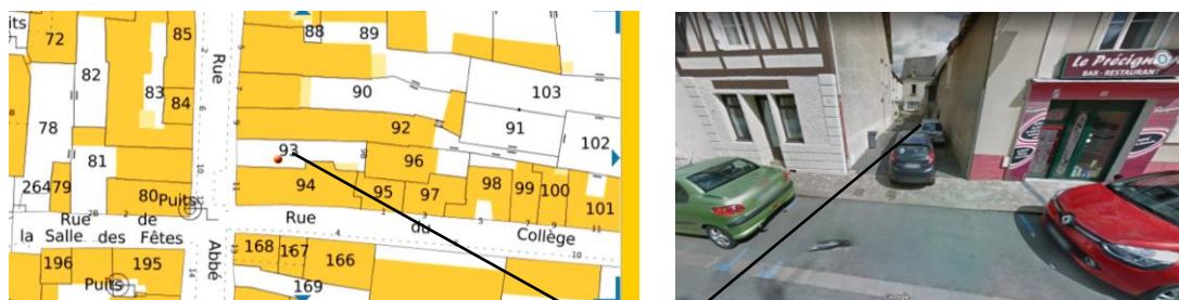
Parcelle AL 0093

Cette parcelle appartient aux familles PELTIER et TRESSY contrairement à ce qui avait été indiqué dans la précédente délibération. Il est proposé de l'acquérir pour la somme de 2 000 € hors frais dont 1 000 € pour la famille PELTIER et 1 000 € pour la famille TRESSY. Cette acquisition est soumise à des servitudes. Elle est réalisée dans le cadre de la réhabilitation du centre bourg.