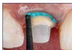
Enkel applikasjon i sulcus