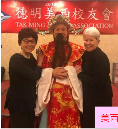
美西校友會春節聯歡 (仁社合照)