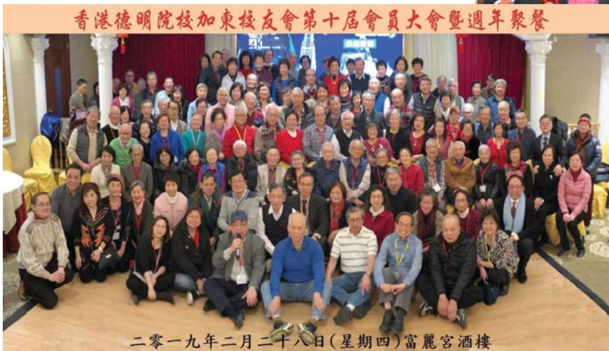
香港德明院校加東校友會第十屆會員大會暨週年聚餐