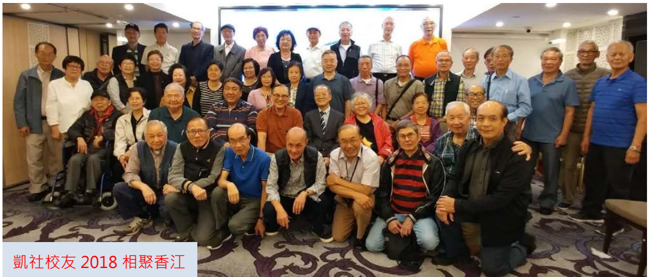
凱社校友 2018 相聚香江