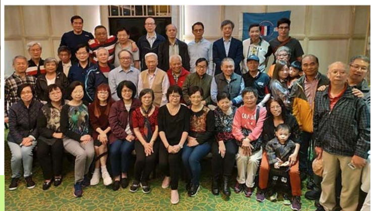
廉社校友聯歡聚餐