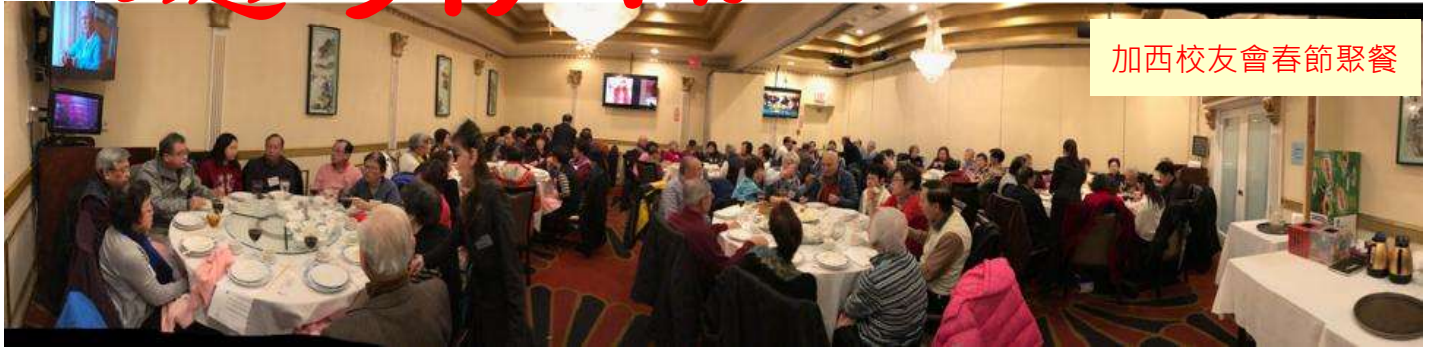
加西校友會春節聚餐