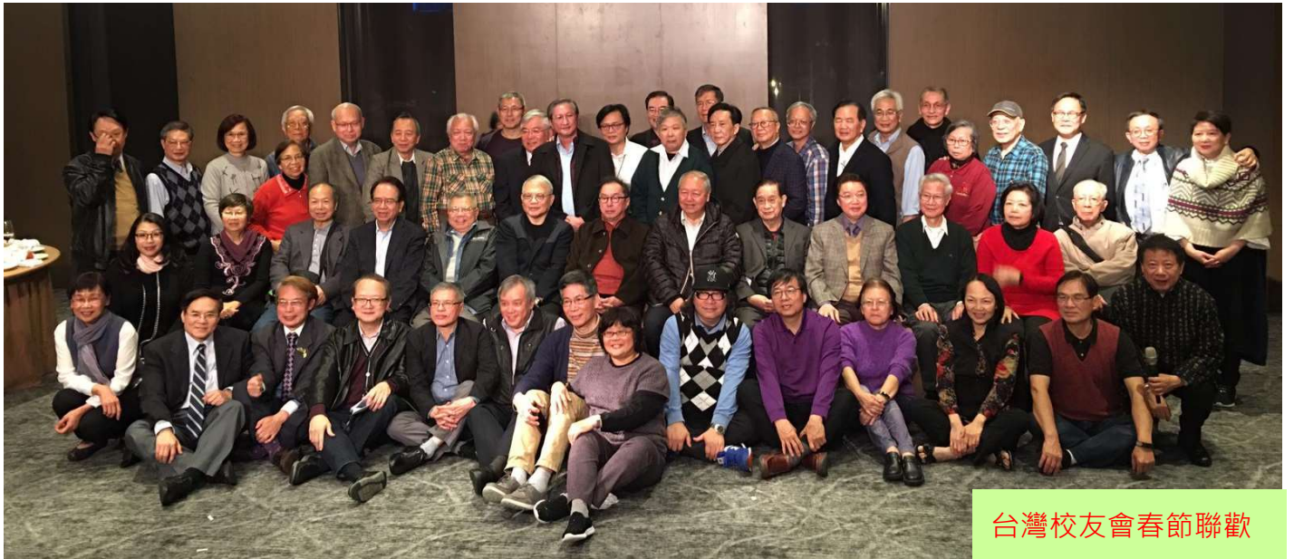
台灣校友會春節聯歡