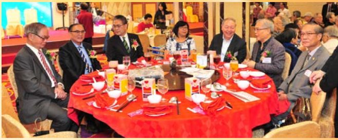
會長、理監事長與 主禮嘉賓及顧問共席