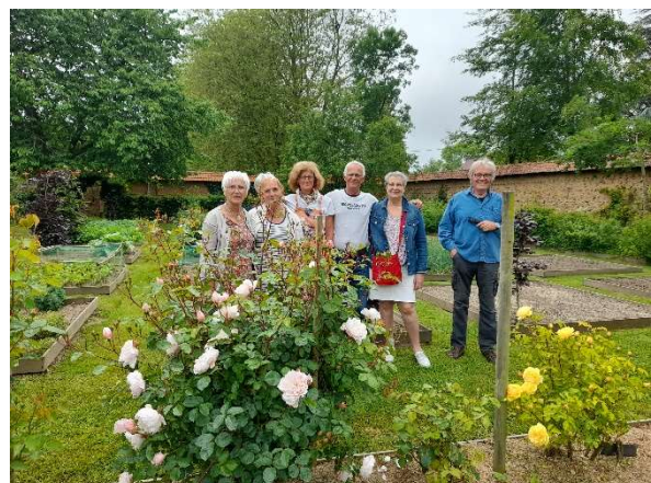
Figure 1 L'équipe des jardiniers, juin 2021

d'un labyrinthe d'arbres fruitiers pour les enfants. Nous avons eu le plaisir d'être lauréats, ce qui nous fait bénéficier d'une subvention de 1711 euros, le complément de financement étant assuré par une opération de financement participatif menée avec un prestataire spécialisé qui sera présentée après