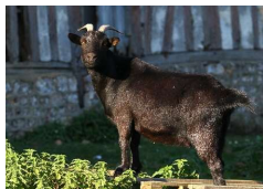
Figure 5 Tempête