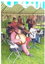
Figure 3 Traverses musicales, marché champêtre, 19 septembre 2021

A l'occasion des Journées du patrimoine, nous avons organisé en Septembre notre deuxième marché champêtre qui fut enfin presque épargné par la pluie ; outre les exposants, nous avons invité « les traverses musicales » pour l'animation et l'association le chêne pour proposer des activités aux enfants.