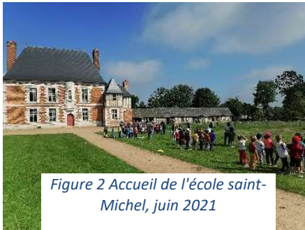
Figure 2 Accueil de l'école saint-Michel, juin 2021

En juin, nous avons accueilli des écoles, nous adaptant aux demandes de chacune d'elles : jeux, jardinage, course d'orientation, connaissance des plantes et arbres du jardin : ont ainsi été accueillies : plusieurs classes de l'école Saint Michel d'Yvetot, l'école d'Allouville Bellefosse, celle de Valliquerville, celle de Bois Himont.