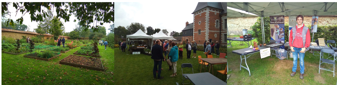
Figure 4 marché champêtre, 19 septembre 2021 (A gauche les carrés potagers, au centre les stands des artisans, à droite l'association Chêne)

A l'occasion des Journées du patrimoine, nous avons organisé en Septembre notre deuxième marché champêtre qui fut enfin presque épargné par la pluie ; outre les exposants, nous avons invité « les traverses musicales » pour l'animation et l'association le chêne pour proposer des activités aux enfants.