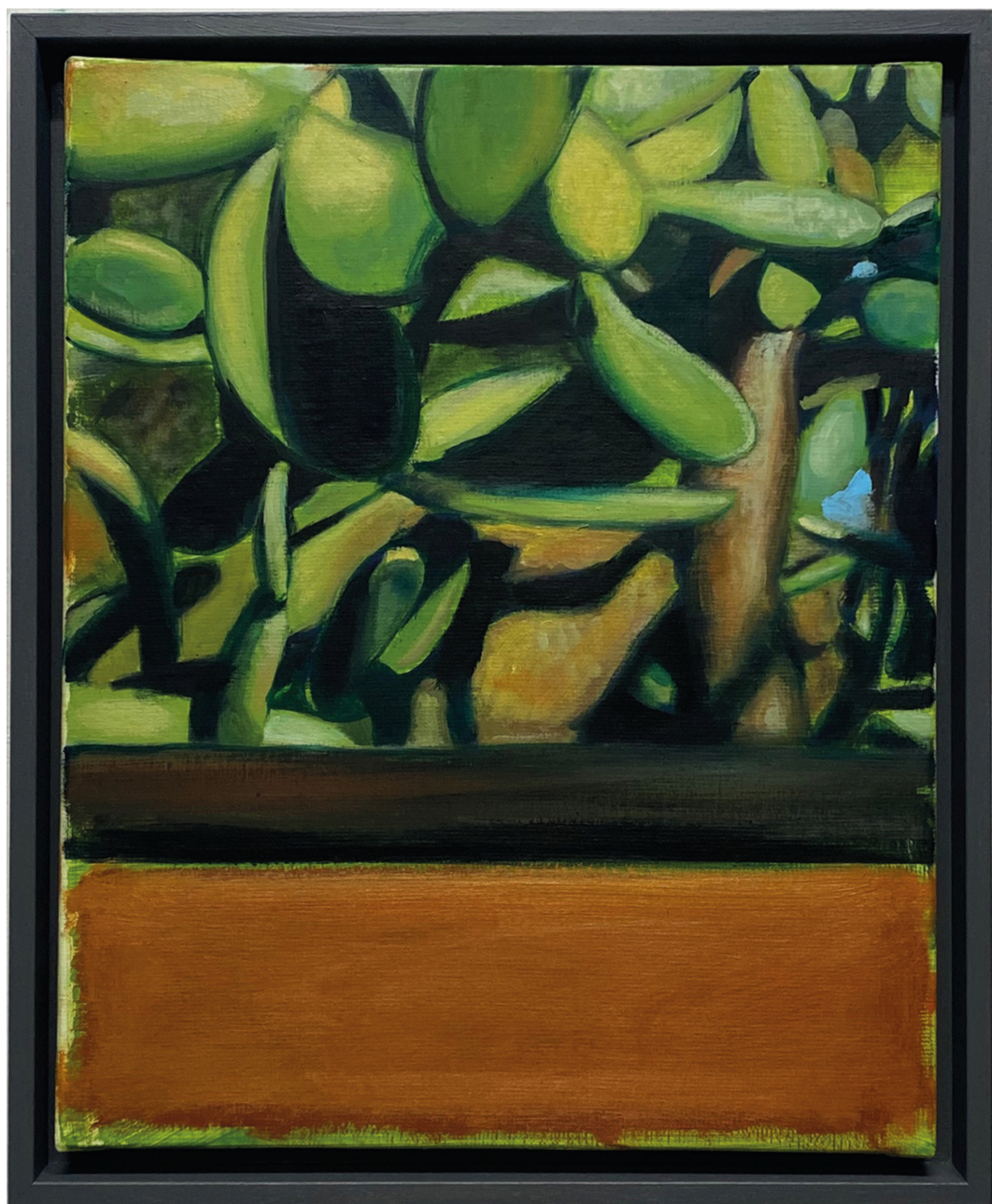
Ci-dessus : Jérémie Liron, Figuier Rothko , 2024, huile sur toile, 41x33 cm, © Cyrille Cauvet