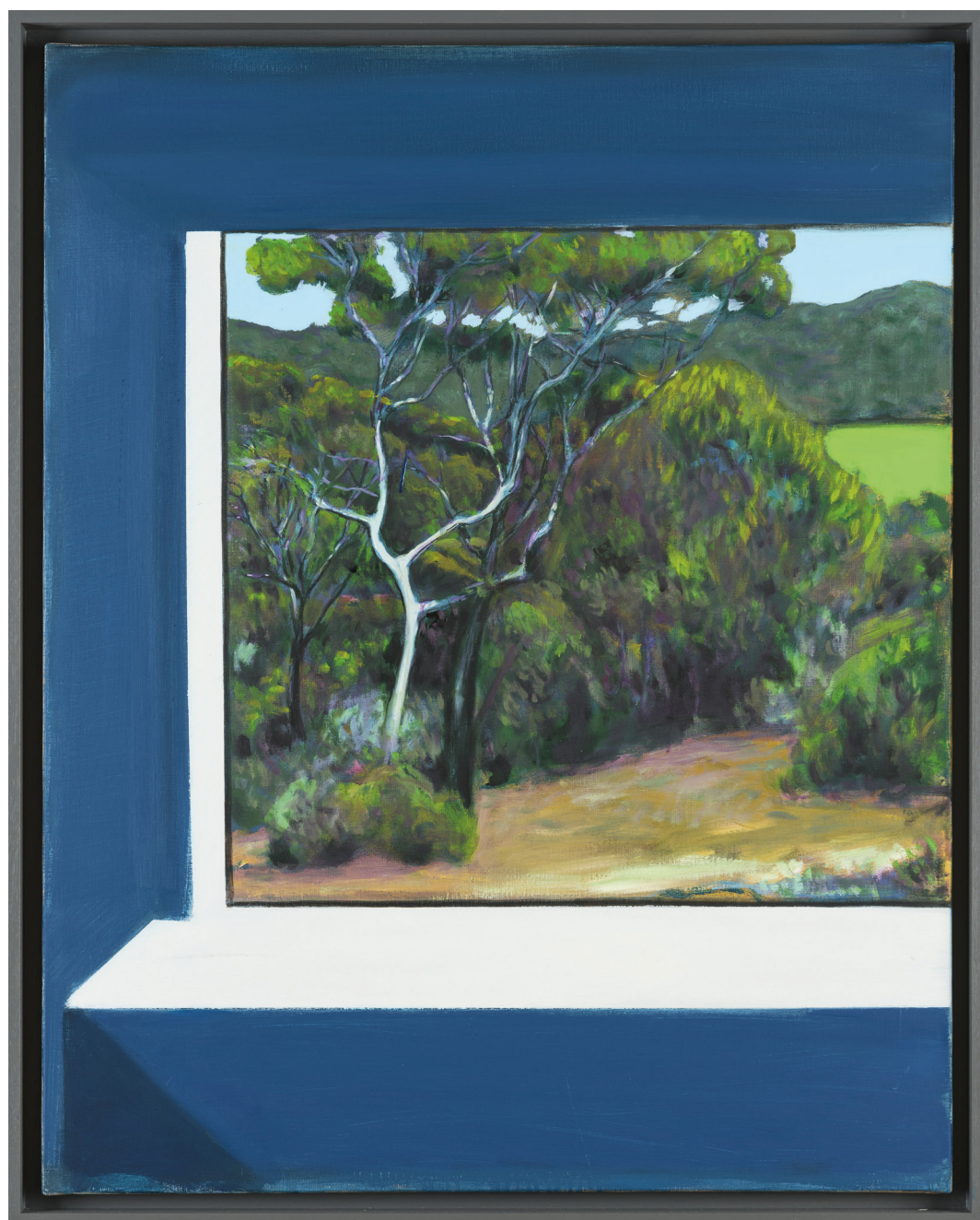
Ci-dessus : Jérémy Liron, Sans titre (fenêtre Carmignac) , 2021, huile sur toile, 93x73 cm