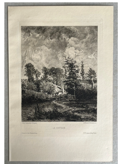
Ci-dessus : Alfred-Louis Brunet-Debaines, d'après John Constable, The Cottage , fin XIXe s. eau-forte, 30.5x21 cm

peinture d'un jardin , huile sur bois, 1947