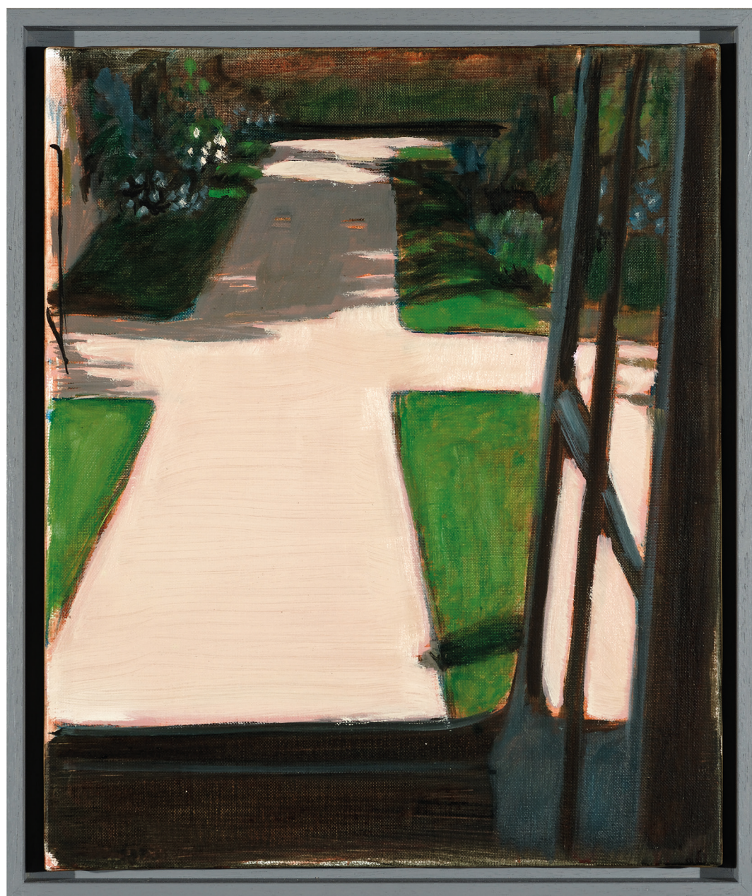
Ci-dessus : Jérémy Liron, SMD F3, 2019 huile sur toile, 50x42 cm