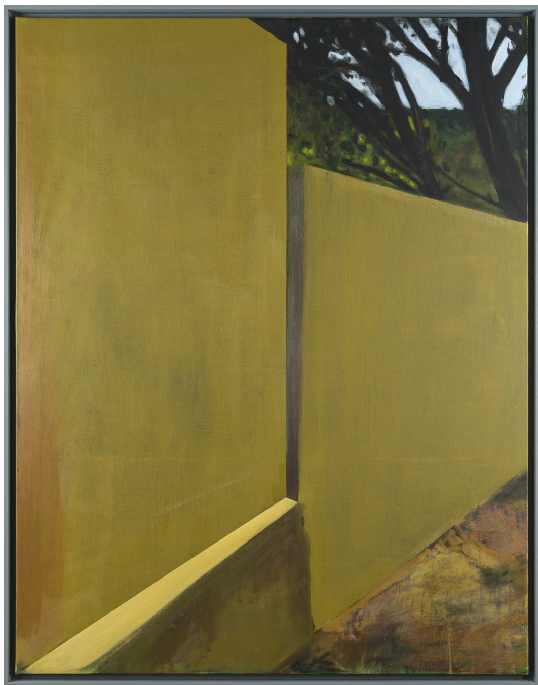
Ci-dessus : Jérémie Liron, Paysage 224 , 2022, huile sur toile, 146x114 cm