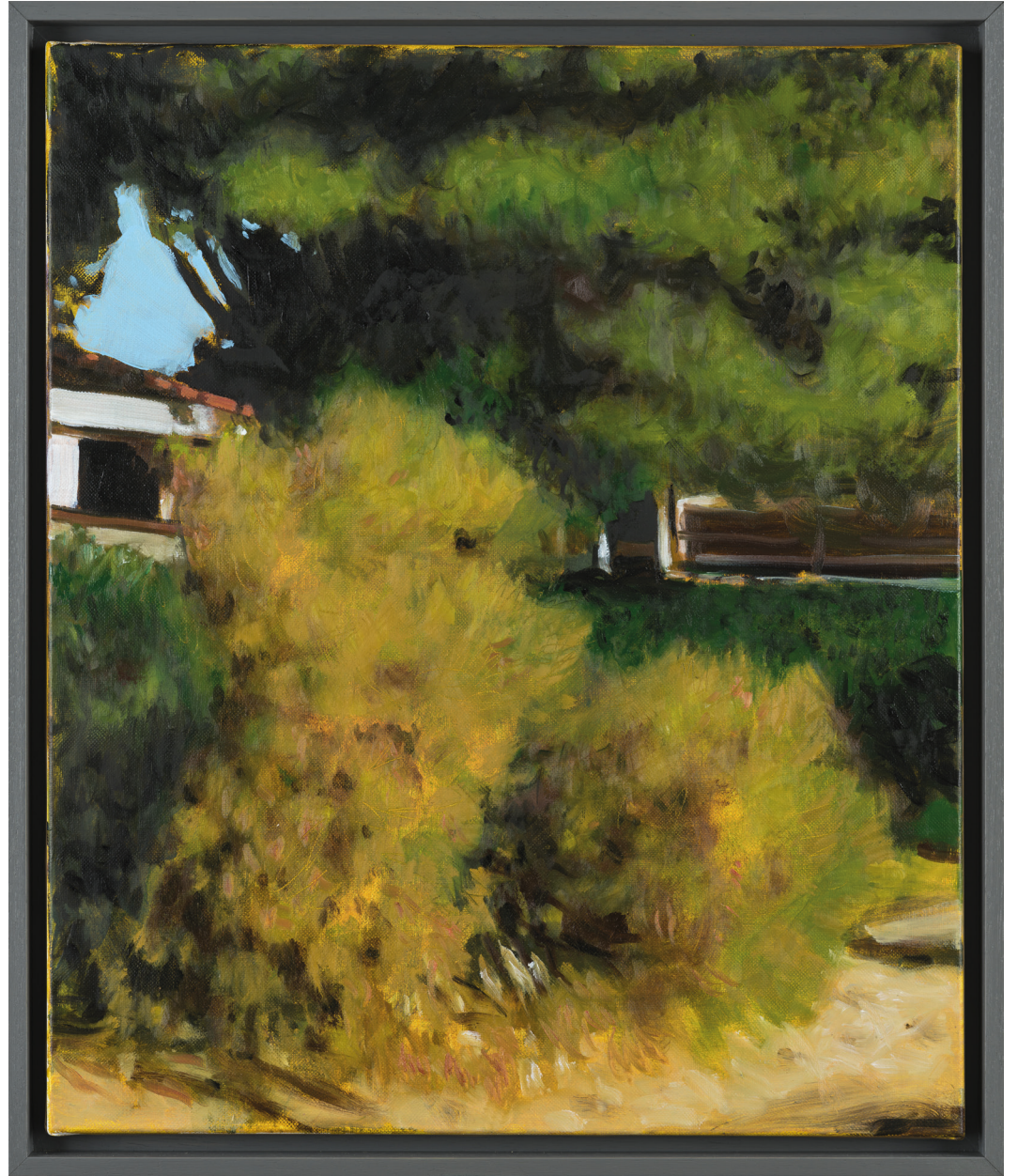
Ci-dessus: Jérémie Liron, Tamaris , 2022 55 x 46 cm, 2022 © Cyrille Cauvet