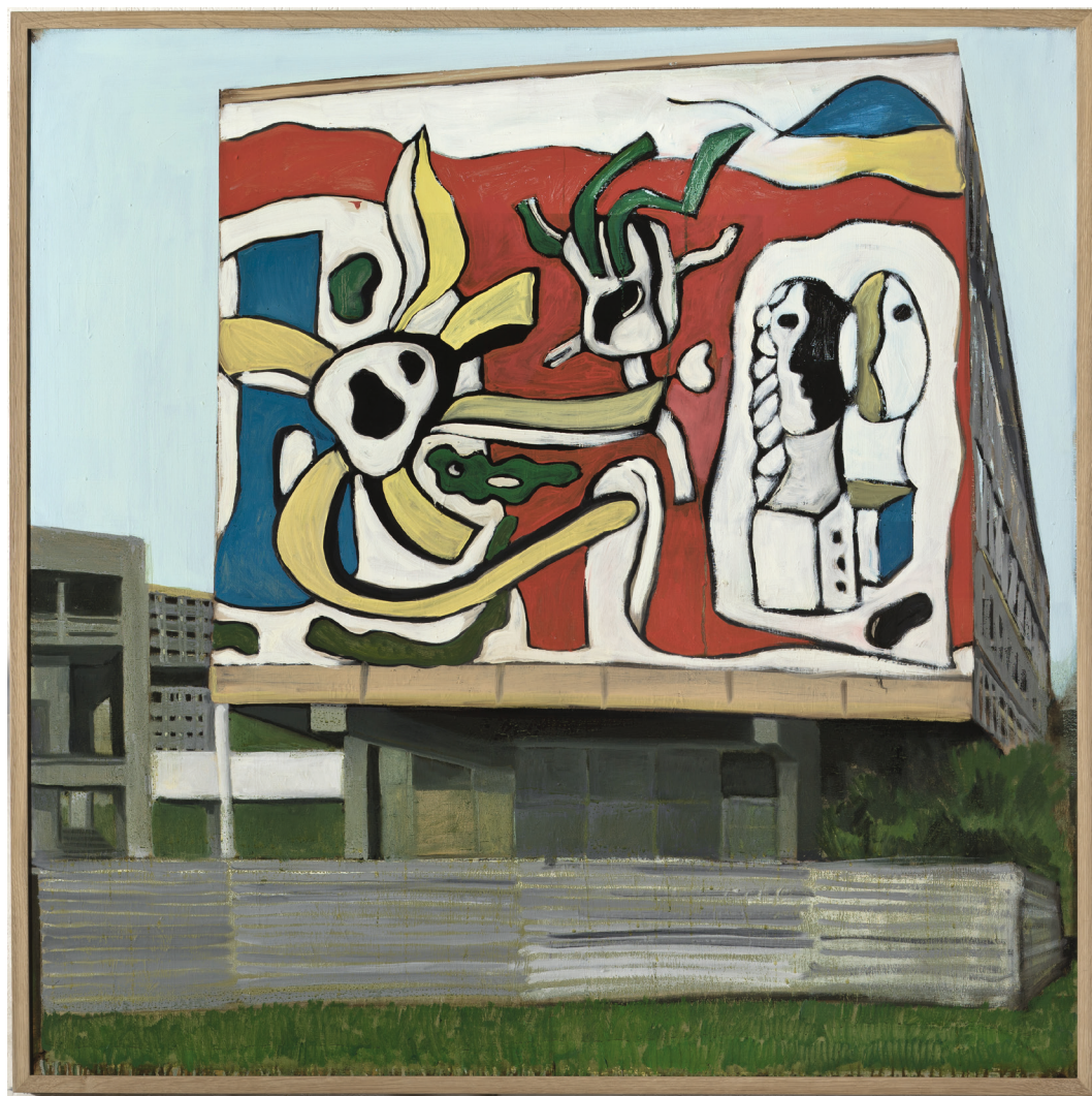
Ci-dessus : Jérémy Liron, Paysage 67 , 2009, huile sur toile, 120x120 cm

Paysage 224 , huile sur toile, 146x114 cm, 2022