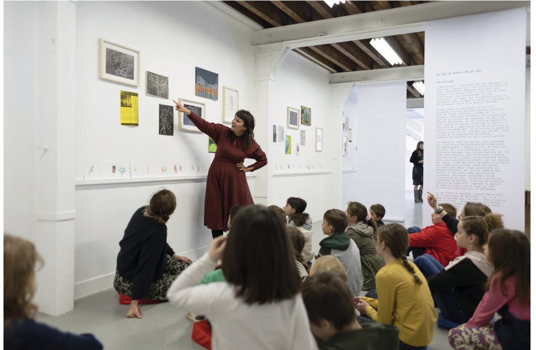
Ci-dessus : galerie Duchamp