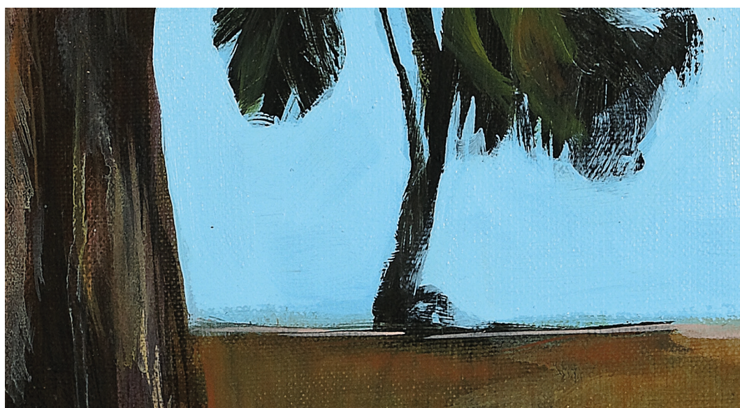
Ci-dessus : Jérémy Liron, SMDF11 , 2019, huile sur toile, 50 x 59 cm, © Cyrille Cauvet

Ainsi, cette exposition propose un accrochage constellaire et poétique, traçant des va-et-vient malicieux et obliques entre sa propre production et les artistes qui l'ont interpellé et qui comme lui, font du paysage l'histoire même de leurs tableaux - une sorte d'interrogation entre ce qu'est une peinture d'histoire et une peinture de paysage.