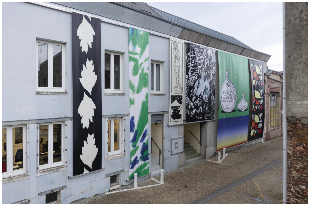
Ci-dessus : galerie Duchamp