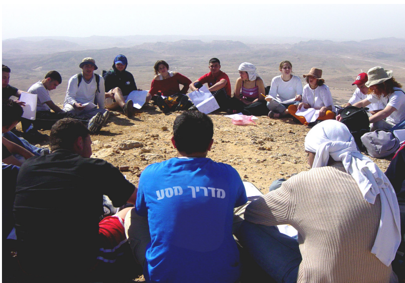
תמונה מאת Shvili82