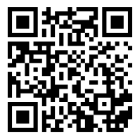
קישור לצפייה בשיר

פזמון: ואולי יבוא יום ונהפך שווים אתה תהיה לי נחל ואני לך - ימים ונזרם ביחד עד אין סוף שניה לפני שקו החוף מגיע שניה לפני שקו החוף מגיע