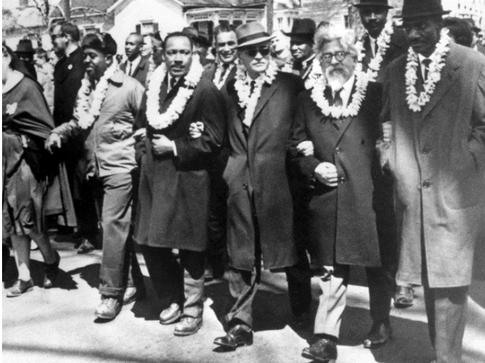
הצעדה בעצרת המחאה, השני מימין השל והרביעי מימין מרטין לותר קינג

השראה לשיח יהודי-דתי בדבר זכויות אדם, נמצאת בדבריו של אברהם יהושע השל כמנהיג דתי המבקש להציג את בשורת היהדות לעולם המודרני. השל אחד הפילוסופים היהודים החשובים של המאה ה-20, ומן הדמויות הבולטות במאבק למען זכויות האזרח בארצות הברית. השל נולד בשנת 1907 בפולין, בן למשפחת אדמו"רים מיוחסת. הוא למד באוניברסיטה בברלין, ולאחר מכן היגר לארצות הברית. השל היה ידידו של מרטין לותר קינג, מנהיג המאבק וצעד אתו יד ביד בעצרת המחאה הגדולה. השל טען כי "זכויות אדם הם האינטרסים של א-לוהים"