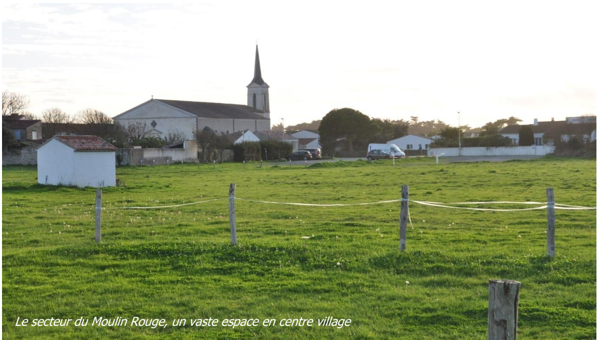
Le secteur du Moulin Rouge, un vaste espace en centre village

C'est l'unique réserve foncière de la commune. Son acquisition a coûté au bas mot 1,2 million d'euros, ce qui est considérable pour Saint-Clément.