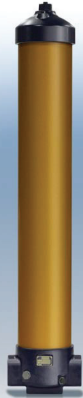
Корпус фильтра серии UR690