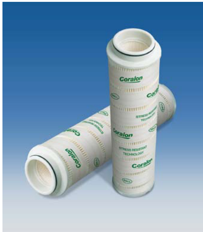
Фильтрующие элементы Coralon