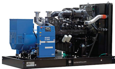
D830 (Открытое исполнение)

(3) Сухая масса: без топлива и охлаждающей жидкости.