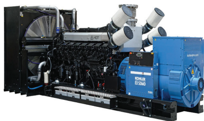
T2000U (Открытое исполнение)

(3) Сухая масса: без топлива и охлаждающей жидкости.