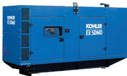
M227 (Шумоизолированное исполнение)