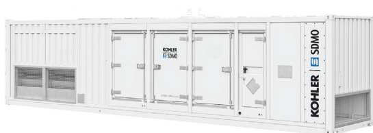
CPU40SI (Контейнерное исполнение)