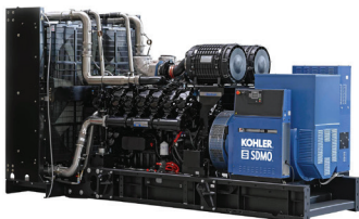
B1400 (Открытое исполнение)

** Размеры и масса без учета системы охлаждения (отдельно стоящий радиатор)