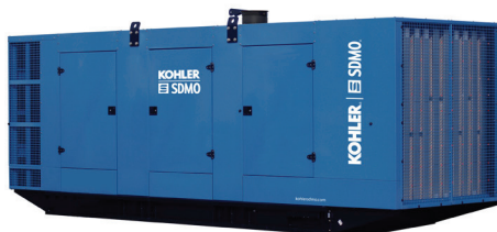
M428SI (Шумоизолированное исполнение)