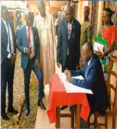
SIGNATURE DU LIVRE D'OR PAR LE MINISTRE DE L'ENSEIGNEMENT SUPE- RIEUR

Le Mercredi 02 Mars 2022, les étudiants de GUTSCHOOL ont eu l'honneur d'accueillir au sein de leur université, le Ministre de l'Enseignement Supérieur, de la Recherche Scientifique et de l'Innovation Technologique. Une rencontre qui a débuté par la levée des couleurs, marquant la rentrée académique effective de l'école supérieure de commerce, GUTSCHOOL. Le chant de l'hymne national a suivi cette levée de couleurs ainsi que les différentes prestations des Clubs Anglais et de danse.