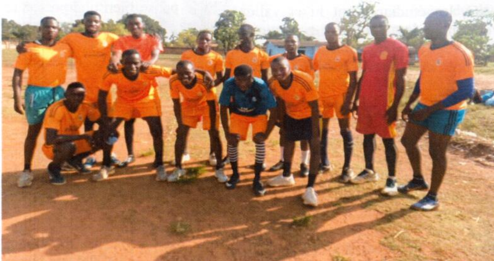
LES ETUDIANTS DE L'IIM