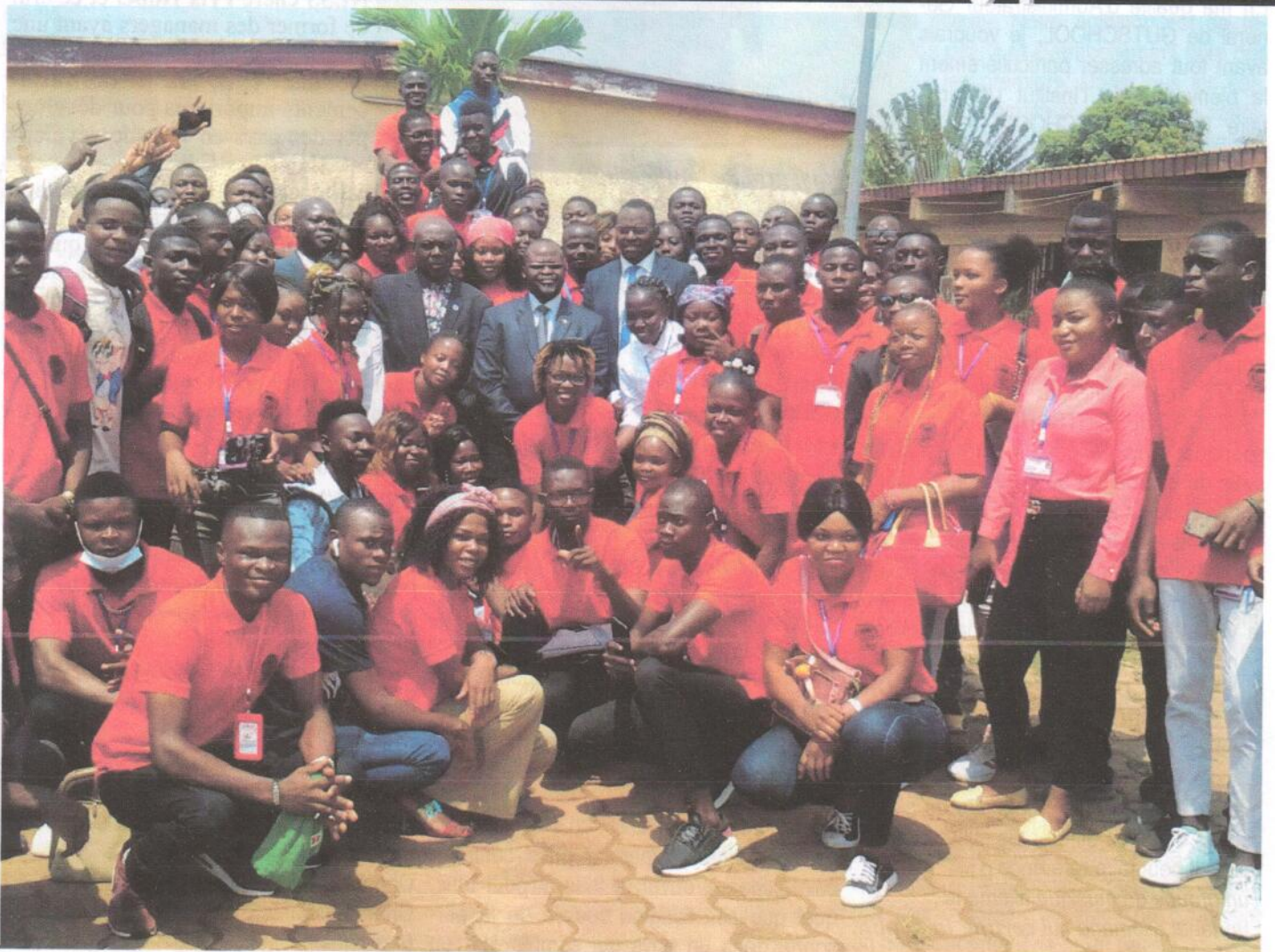
Photo de famille qui immortalise la visite du Ministre à GUTSCHOOL

Rentrée Académique 2021-2022 à GUTSCHOOL présidée par le Ministre de l'Enseignement supérieur, de la recherche scientifique et de l'innovation technologique